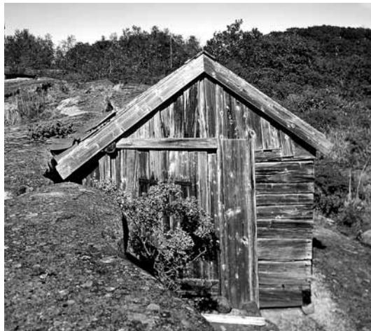
Flera medlemmar har hört av sig, oroliga för hur vi slår vakt om vårt oersättliga kulturarv i skärgården

är viktig. Flera medlemmar hör av sig och undrar vad som kan göras för att stävja att man på sikt bygger bort de miljöer som ligger så många så varmt om hjärtat. Starka känslor är i omlopp och folk antyder att tjuvknep används i jakten på kvadratmetrar, större ljusinsläpp och ökad bekvämlighet i bodarna.