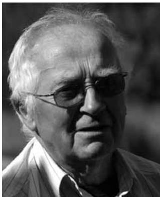
Historiken om Refsnäs har skrivits av Kjell Åhlander.

Ingen skulle nog köpa sig en tomt här med den där enorma vindkraftanläggningen alldeles intill. Då skulle bygden här snarare gå bakåt än framåt.