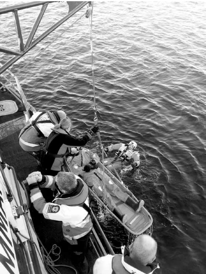
Stenhammar i sjön (NV 20 m/s, Söderarmsleden).