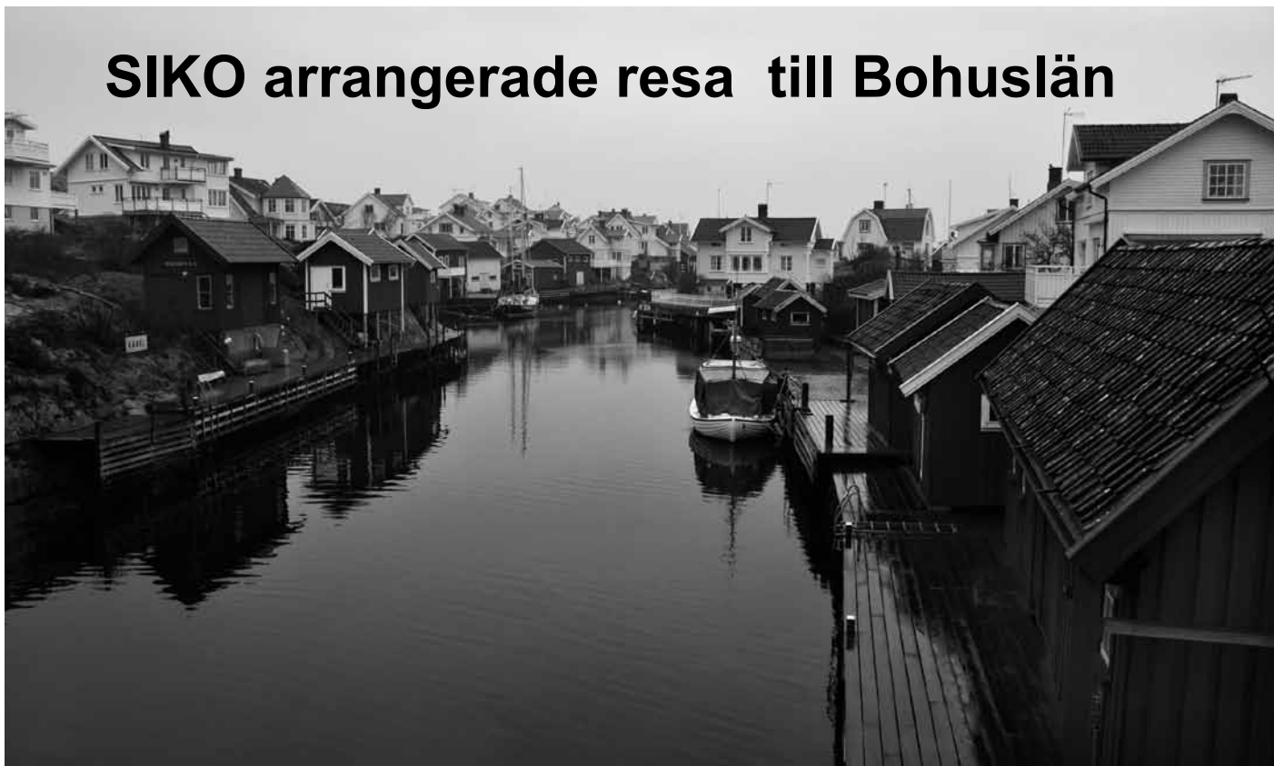
Grundsund i dis

Torsdagen den 15 mars rullade en buss med 16 vetgiriga skärgårdsbor för att få information om såväl dåtid som nutid ifråga om Öckerö-öarna samt för att utbyta erfarenheter med representanter för lokala öråd, BSR och SRF/ Skärgårds-Leader.