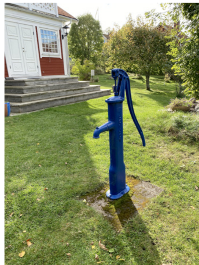
Den här fungerar utan el, bara det finns vatten.

För ovanlighetens skull hade SIKO även bjudit in ett företag, Aquify, som mäter vattentillgång i brunnar. Just nu finns utrustning installerad i cirka 150 brunnar i Stockholms skärgård. Det fungerar så att man har en sändare och ett mätinstrument nere i brunnen som mäter trycket.