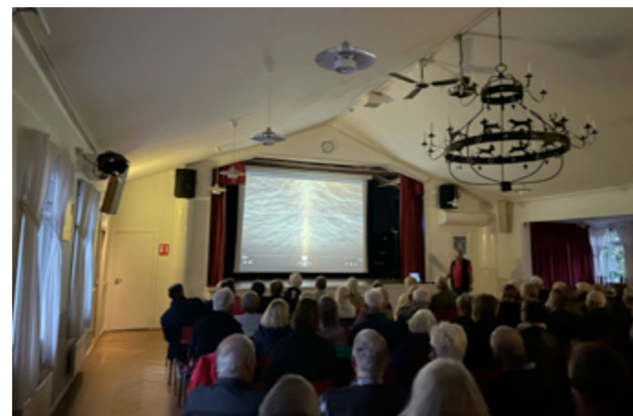
Välbesökt i Lännagården när filmen Skärgårdsliv visades.

Det har varit lite tunt med medlemsaktiviteter det senaste året. Därför var det extra roligt att kunna erbjuda medlemmarna en filmkväll.