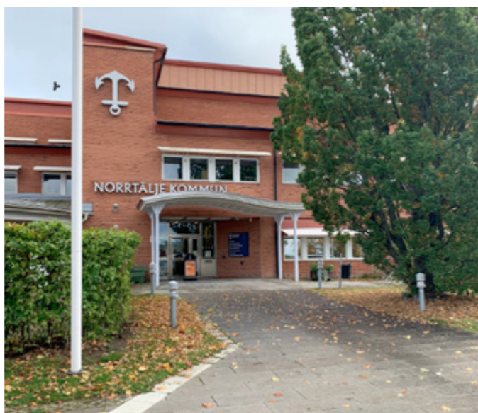
Det är mycket prat och förstående nickar på Skärgårdsrådets möten, men det är också allt.

MEDLEMSBLADET ges ut av Blidö-Frötuna Skärgårdsförening, c/o Lena Hammarbäck, Västra Fällgatevägen 18, 76017 Blidö • www.bfsf.se • bankgiro: 439-8152 • swish: 1231658541