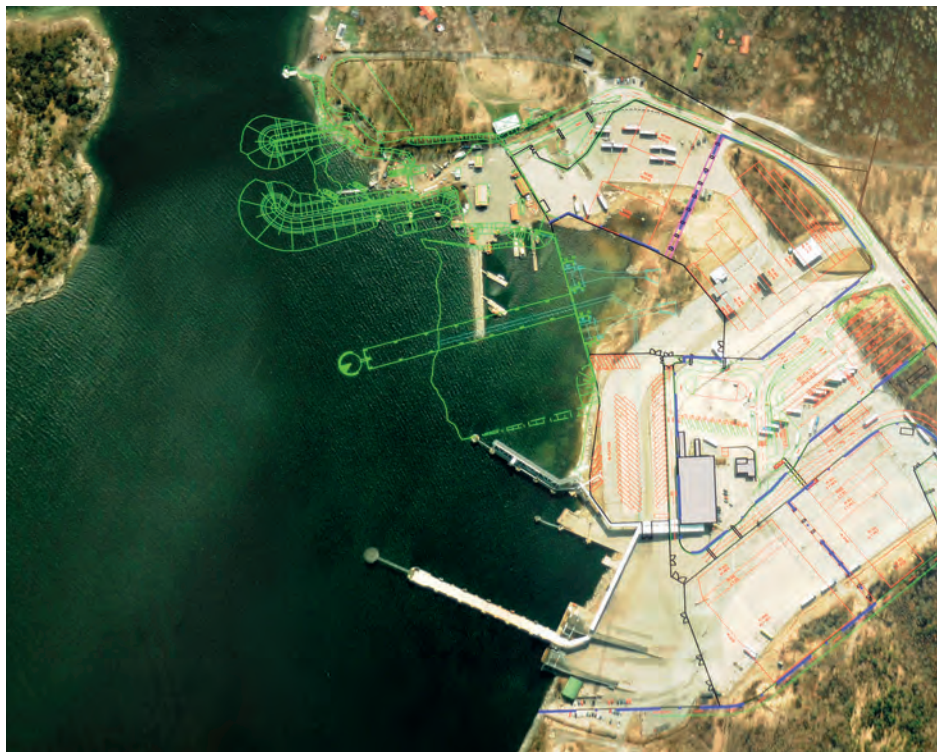
Sjöfartverkets lotshamn flyttas söder ut.

De första arbetena omfattar en fördjupning av hamnbassängen, utfyllnad av vik samt byggnation av lotshamn. Vid muddringen fraktas de lösa massorna ut till Uddjupet och bergmassorna används i projektet.