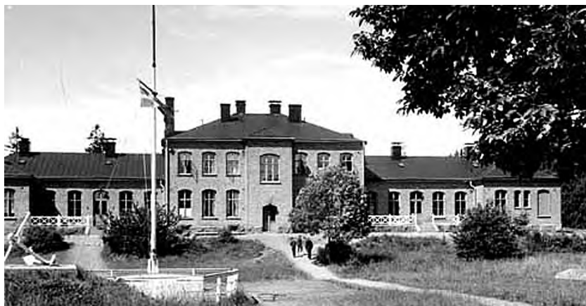
Sjukhuset von Döbeln var under 50-talet förläggning för Sjövärnskåren.

Men livet på Fejan tog ny fart då Skärgårdsstiftelsen 1994 arrenderade en del av den mark som nuvarande Fortifikationsverket äger och rustade upp befintliga byggnader. I dag är det vandrarhem i det ursprungliga sjukhus som stod klart 1892 och huset nere vid bryggan har gått från att vara likbod till mastskjul till den välbesökta skärgårdskrog det är i dag.