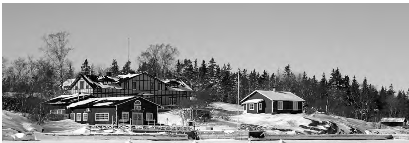
Det gamla kolerajukhuset, Wasa, är numera vandrarhem.