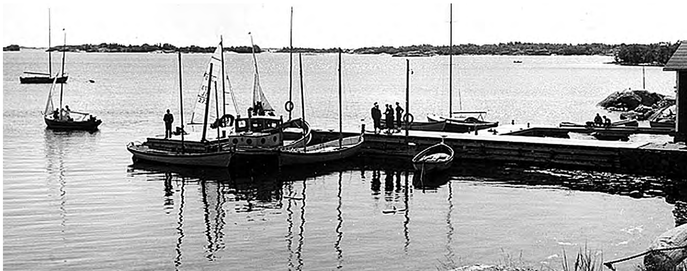
Många var de killar och tjejer som lärde sig sina första sjövettsregler på Sveriges Flottas seglarlägar.