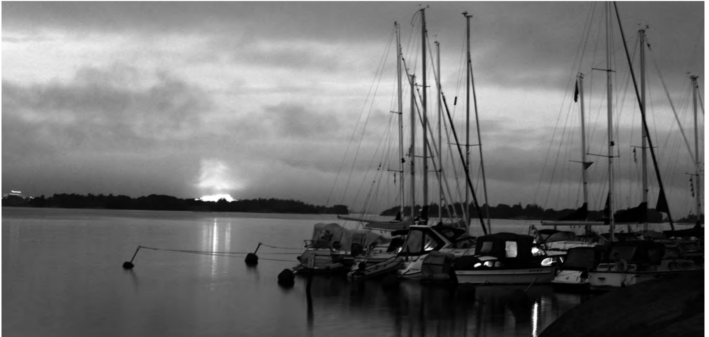
Det är tätt mellan färjorna.